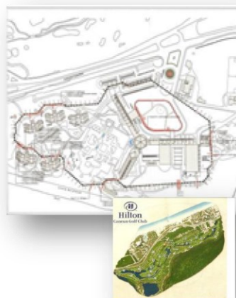
CANCUN, MEX Gerencia de Proyecto de Golf 18,000 m2 The John Hardy Group Atlanta Jones Lang Lasalle