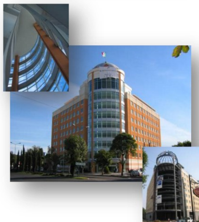
HOLIDAY INN EXPRESS PUEBLA, MEX. Gerencia de Construcción 116,000 ft2 Grupo Beck