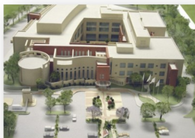
SCHRINERS MEXICO, D.F Acabados interiores Oficinas 11,400 m2 Grupo Beck