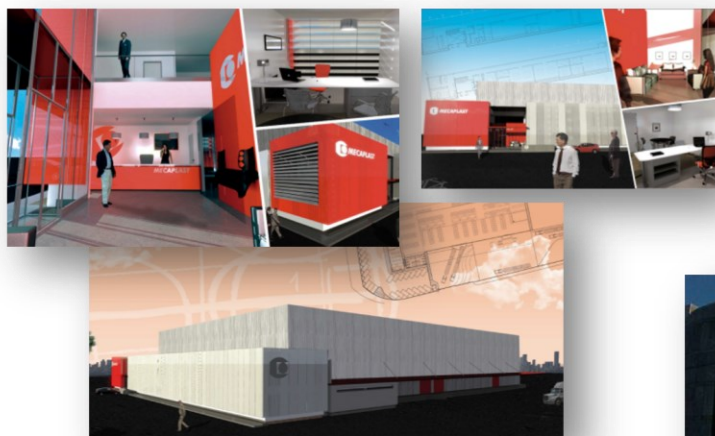
MECAPLAST SILAO GTO.MEXICO Diseño de Construcción 20,200 m2