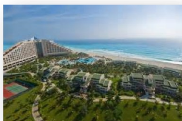
HILTON GOLF CLUB & HOTEL CANCUN, Q.ROO Red PCI, Interiores Remodelación del Hotel - campo de Golf - Joint Venture The John Hardy Group Atlanta GA