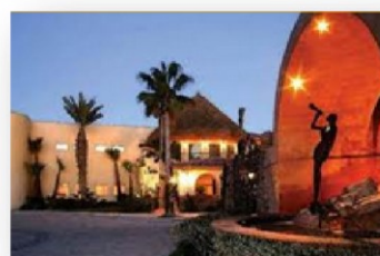
HOTEL BELLA SIRENA PUERTO PEÑASCO, SON. Obra Civil e Interiores Red PCI e Interiores