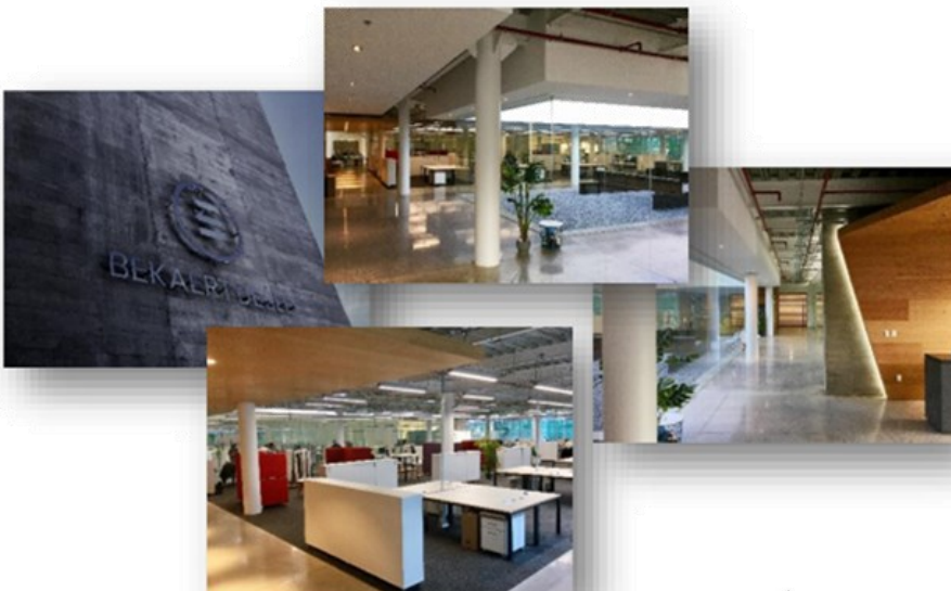
Nueva Planta Beckaerr Deslee Design Built 2020/2021