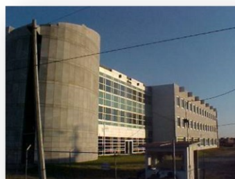
CIMA PUEBLA, PUEBLA Acabados interiores Construction 12,500 m2